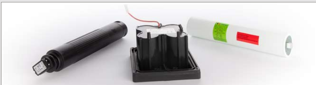
Linternas de uso policial y ferroviario

Al igual que el resto de productos, AMOPACK se adapta al diseño deseado del cliente para conseguir linternas que se distinguen por su ergonomía, equilibrio de pesos y fiabilidad.